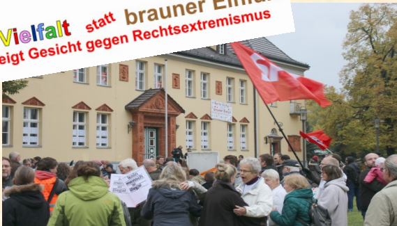
17. Oktober Veltener Bürger demonstrieren gegen Rechts

Bunte Vielfalt statt brauner Einfalt Velten zeigt Gesicht gegen Rechtsextremismus