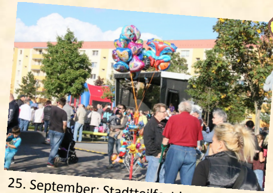
25. September: Stadtteilfest in Velten Süd