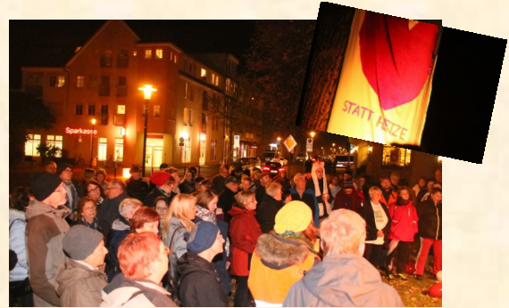
5. November: Mahnwache gegen Gewalt und Rassismus