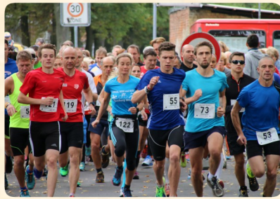
20. September: Velten läuft