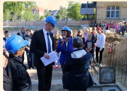
25. September: Grundsteinlegung für das Kommunikationszentrum (Lindengrundschule)