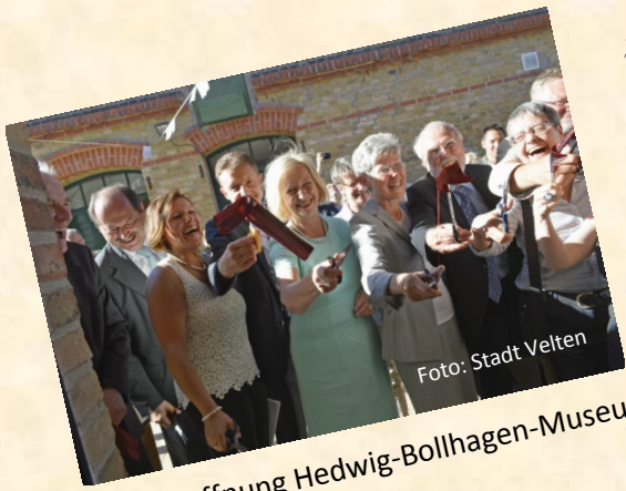
2. Juli: Eröffnung Hedwig-Bollhagen-Museum